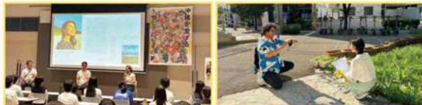
2024年8月に開催した沖縄ドリームキャンプでは、オキナワドリーム2022の副総裁 沖縄で育ちながら世界をいくつも制作してきたHAPPY EARTHの代表取締役 副社長、うな—んちゅの夢を語るノンフィクション作家の登場、 沖縄で育ちながら世界をいくつも制作してきたHAPPY EARTHの代表取締役 副社長と、中学生たちが自分の夢をテーマに動画制作に挑戦。

書籍「WE HAVE A DREAM 沖縄を愛するうな—んちゅの夢」をきっかけに自分の夢を描いてくれた中学生のみなさん を「沖縄ドリームキャンプ」へご招待します！一般社団法人沖縄未来人材育成ラボとのコラボレーションにより、中学生と 社会人(企業・団体)との交流型イベントやワークショップを実施。たいせつな夢を一步でも近づけるようお手伝いをします！